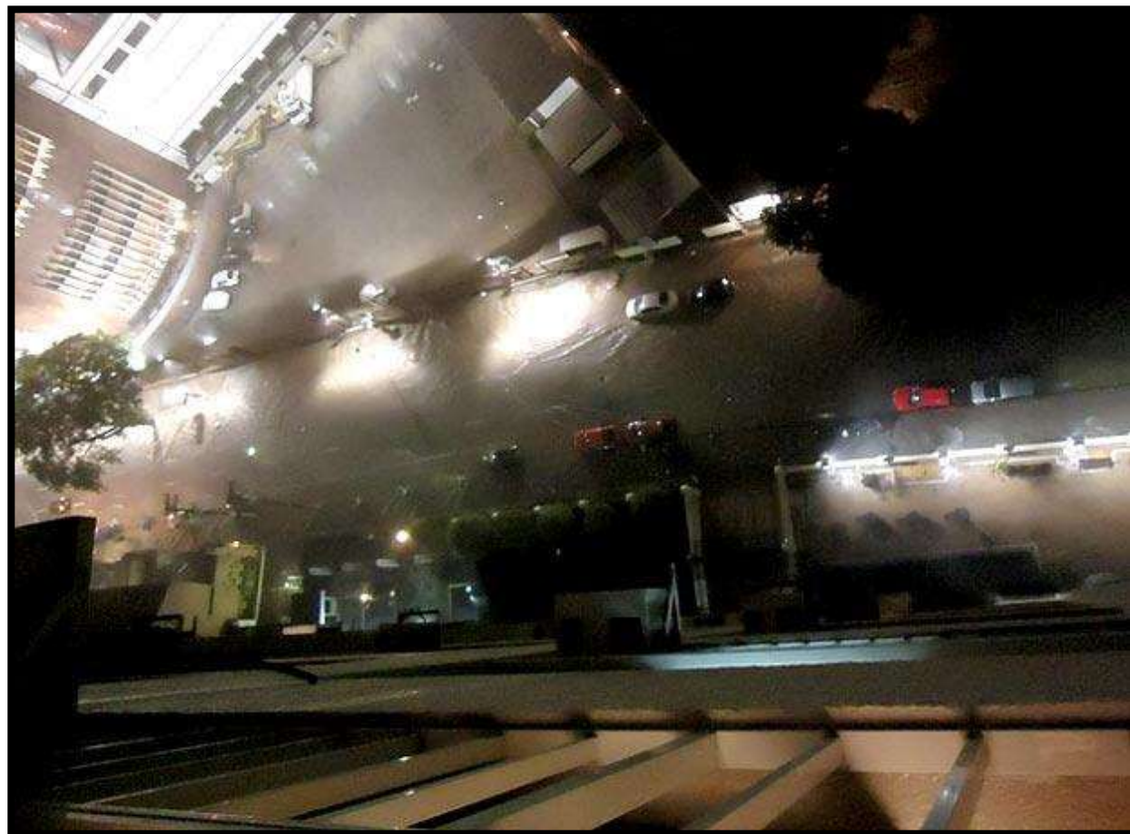
Avenida Pompéia fica submersa após chuva na zona oeste