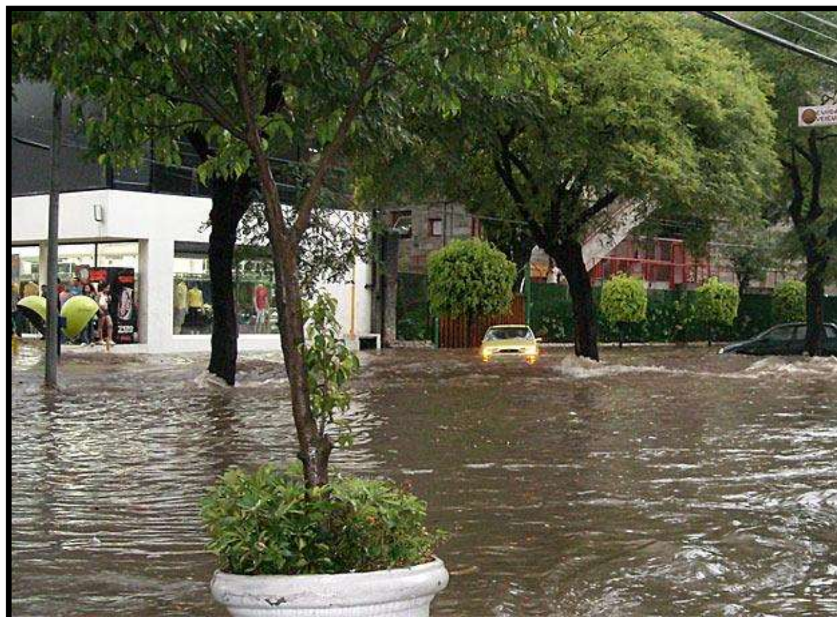
Avenida Pompéia fica submersa após chuva na zona oeste da capital paulista