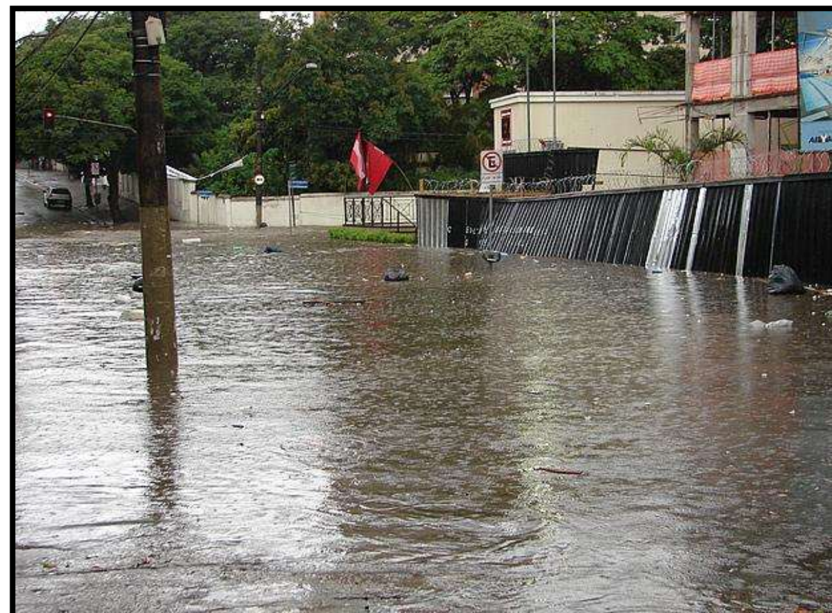
Grade que protege construção quase desaba devido à forte chuva no bairro da Lapa