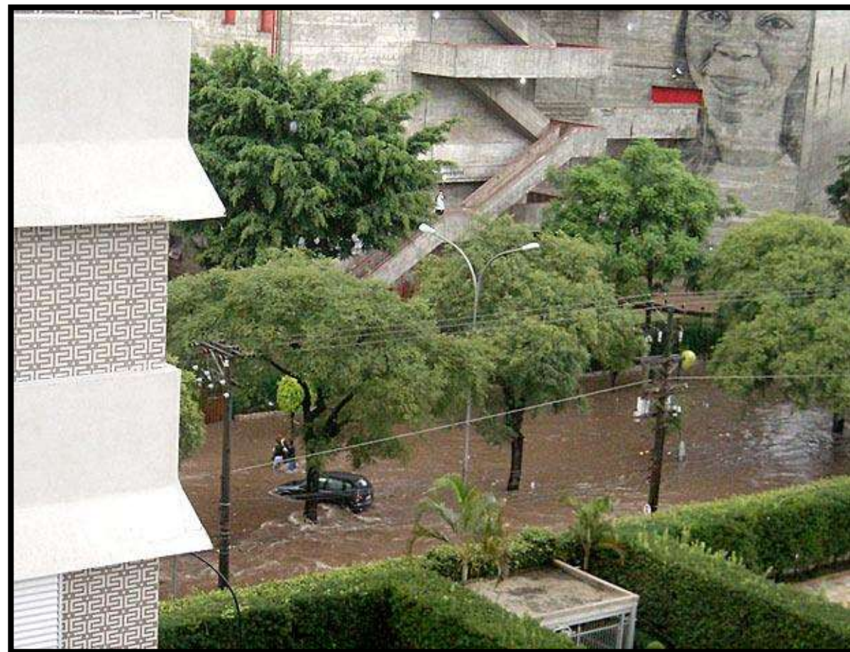
Alagamento atinge rua do Sesc Pompéia, em São Paulo